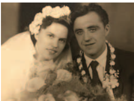
manželka Vargovci slávia v tomto roku 66. výročie spoločného života